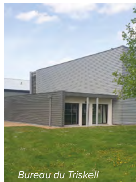
Bureau du Triskell