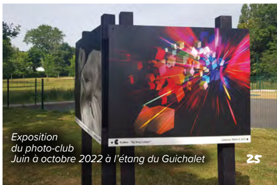
Exposition du photo-club Juin à octobre 2022 à l'étang du Guichalet